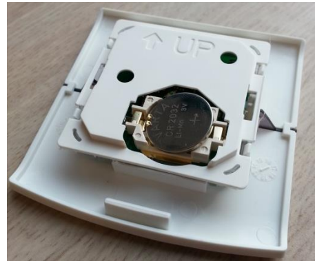
Fig. 4 - Batterij in juiste positie.