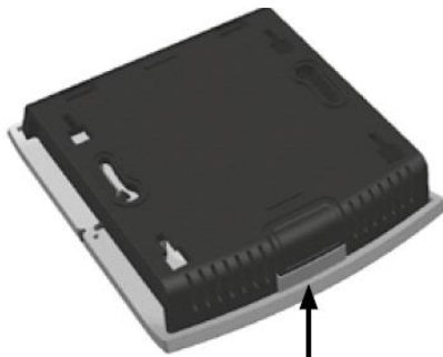
Drukknop openen bediening Fig. 1 - Achterzijde afstandsbediening

Let op: Gooi lege batterijen niet bij het huisvuil, maar breng ze naar de inzamelpunten voor klein chemisch afval.