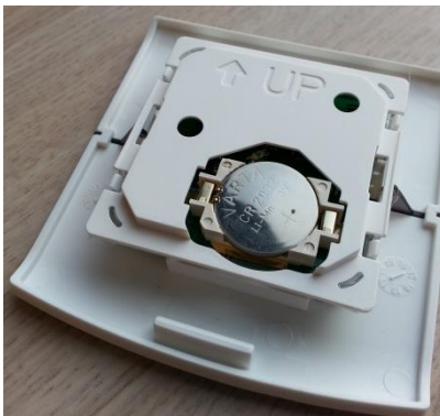
Fig. 5 - Batterij aandrukken.